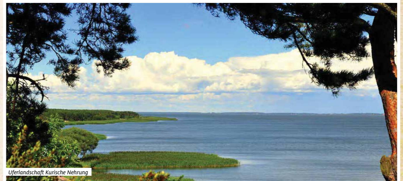
Uferlandschaft Kurische Nehrung

Preis pro Person: im Doppelzimmer 1788 € Einzelzimmerzuschlag 250 €