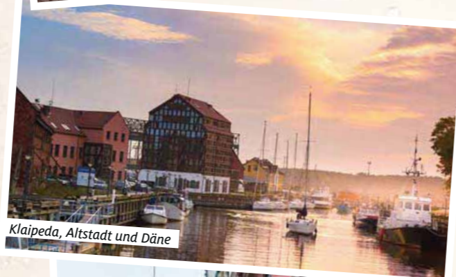
Klaipeda, Altstadt und Däne