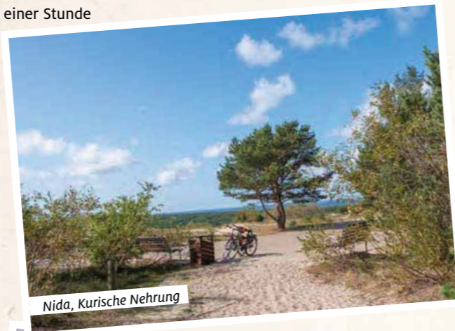
Nida, Kurische Nehrung