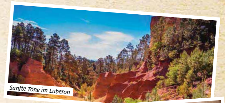
Sanfte Töne im Luberon

Einreisebestimmung für deutsche Staatsbürger: gültiger Personalausweis oder Reisepass.