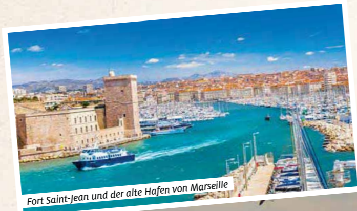
Fort Saint-Jean und der alte Hafen von Marseille