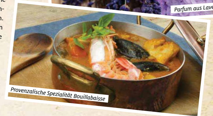
Provenzalische Spezialität Bouillabaisse

Preis pro Person: im Doppelzimmer 1999 € Einzelzimmerzuschlag 350 €