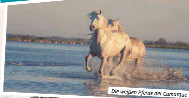
Die weißen Pferde der Camargue