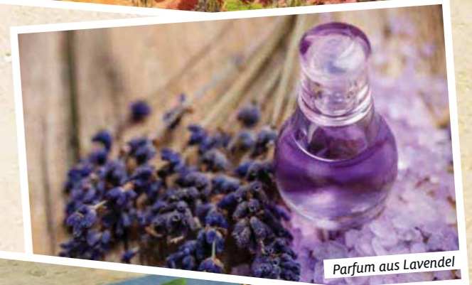
Parfum aus Lavendel