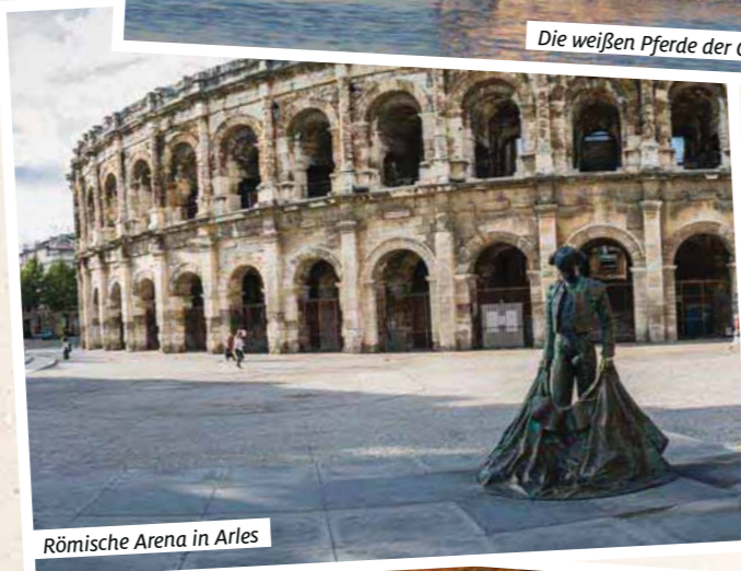
Römische Arena in Arles